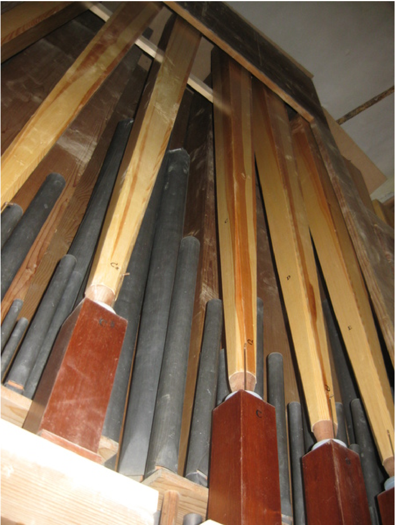
die neue Posaune