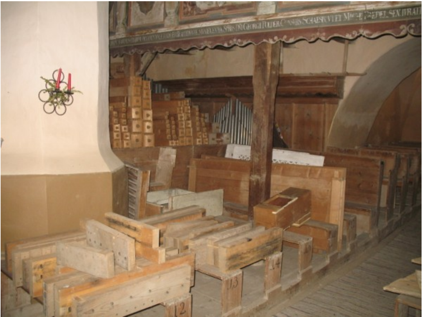
Während der Reparatur 2009