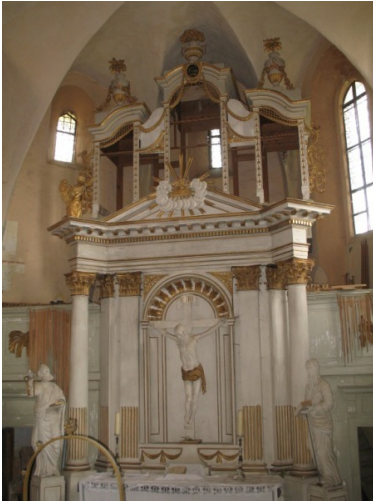
Orgel ausgebaut (2009)