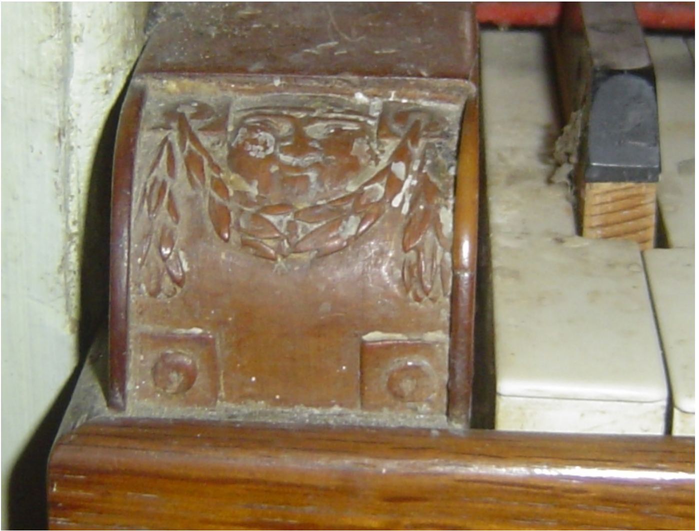
Linke Klaviaturbacke, original Prause; ähnlich wie in Bistritz