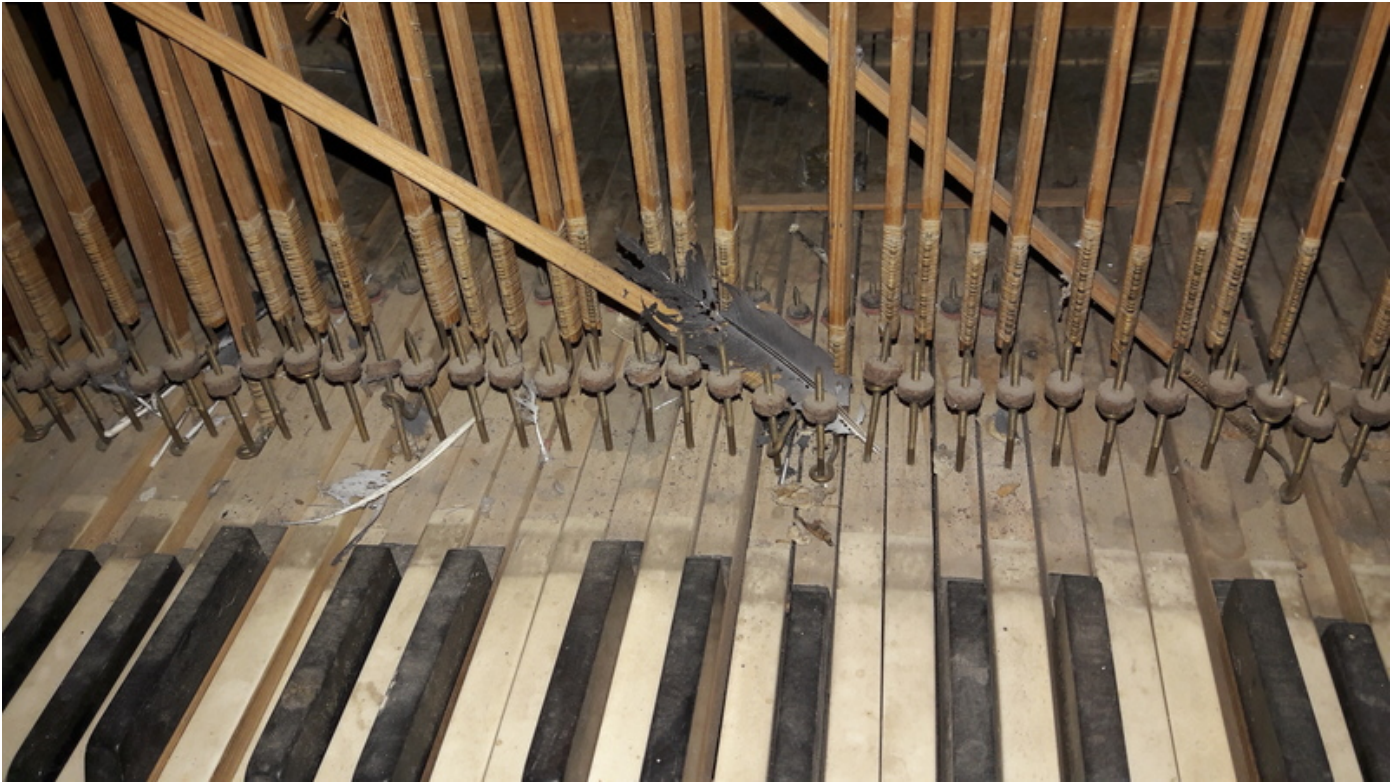
Marderspuren in der Orgel