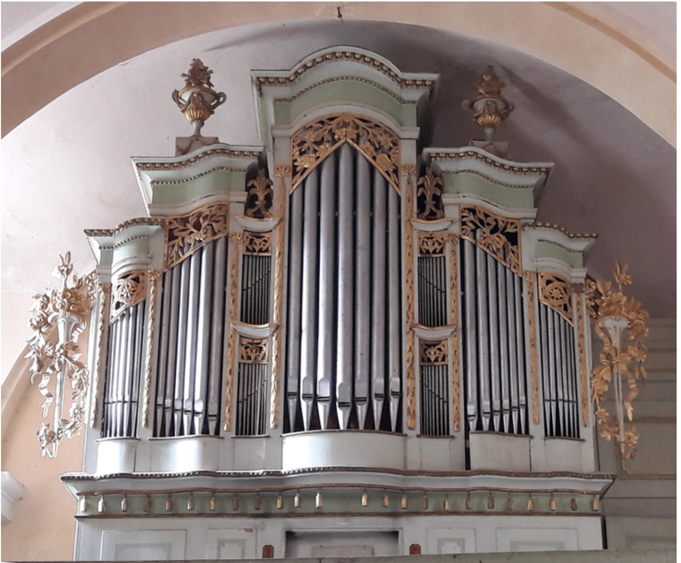
Prospekt von Prause