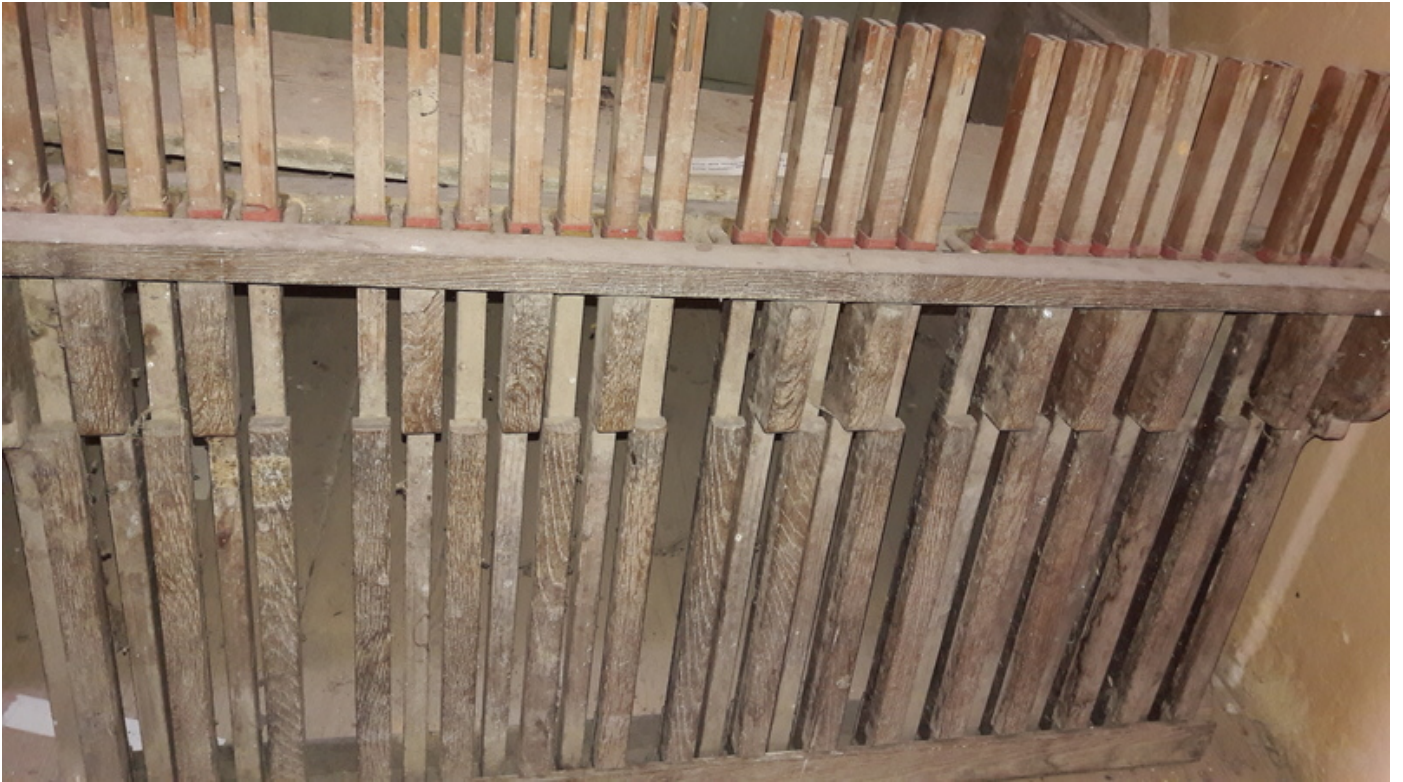
Pedal, steht neben der Orgel