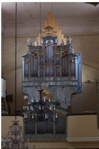
Prospekt vor 2010