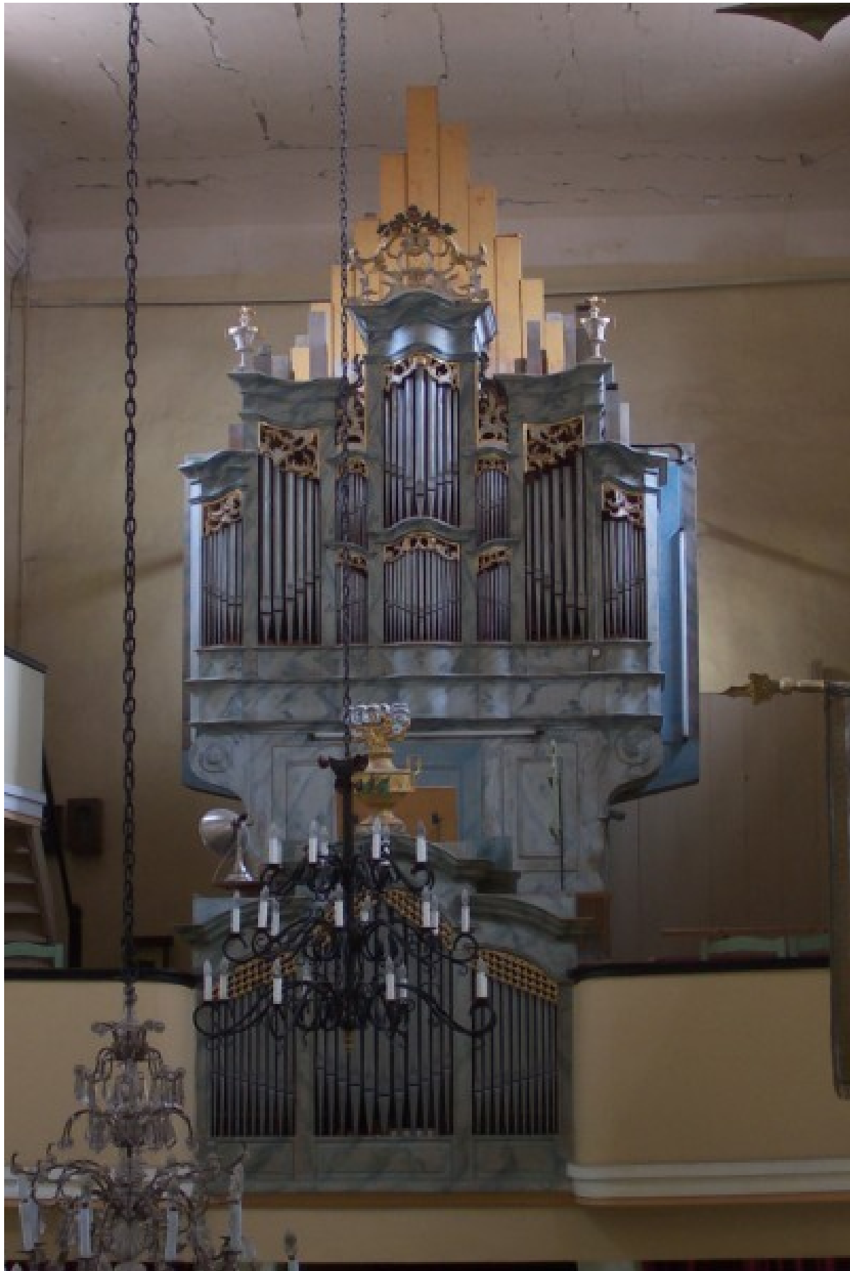
Prospekt vor 2010