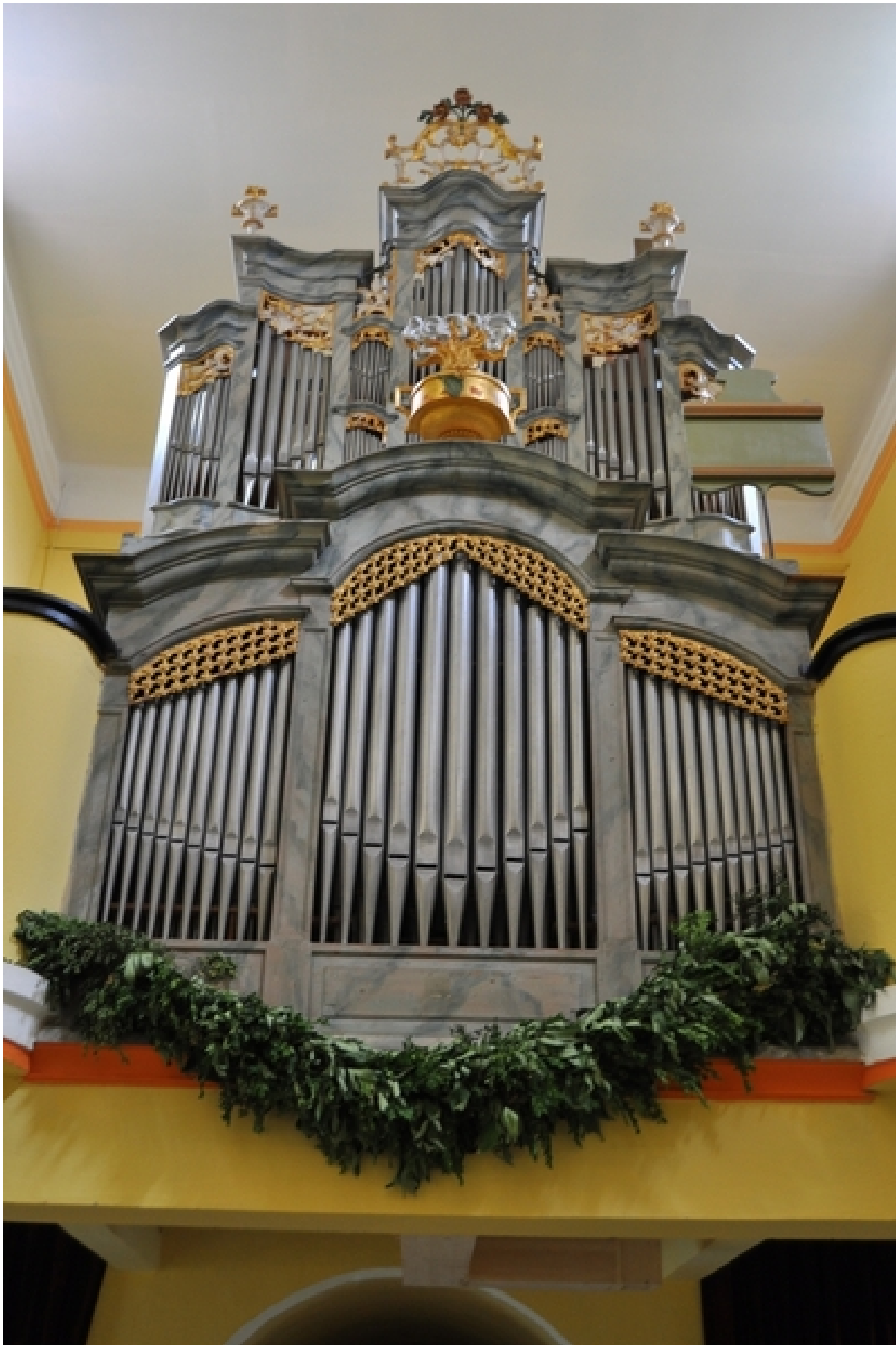
Bei der Einweihung