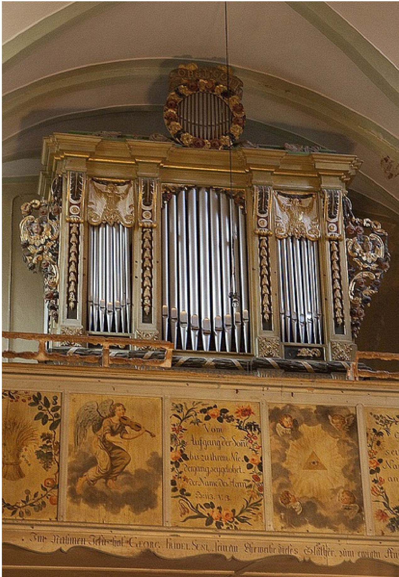
Prospekt mit Brüstung