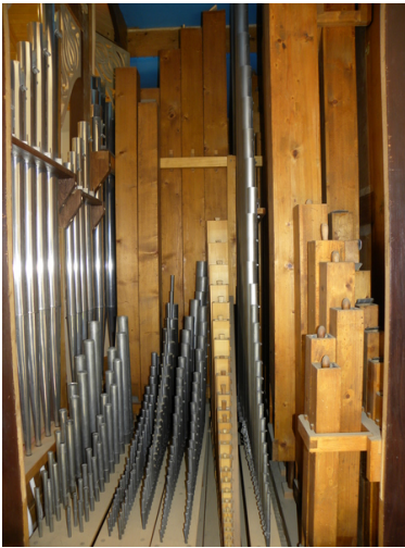
Orgelinneres am neuen Standort