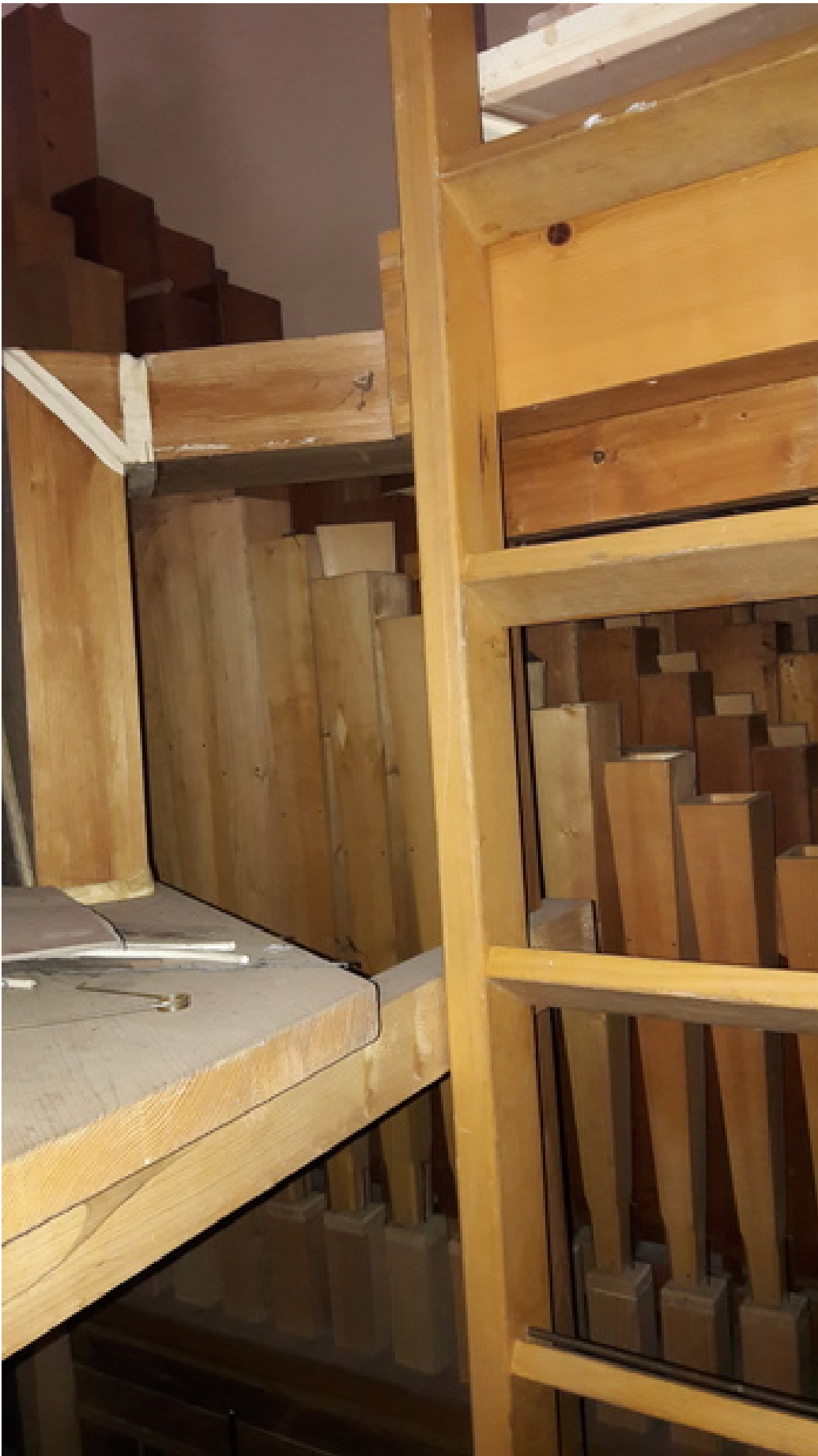
Pedalwerk mit Kopie der Prausetrompete im Pedal