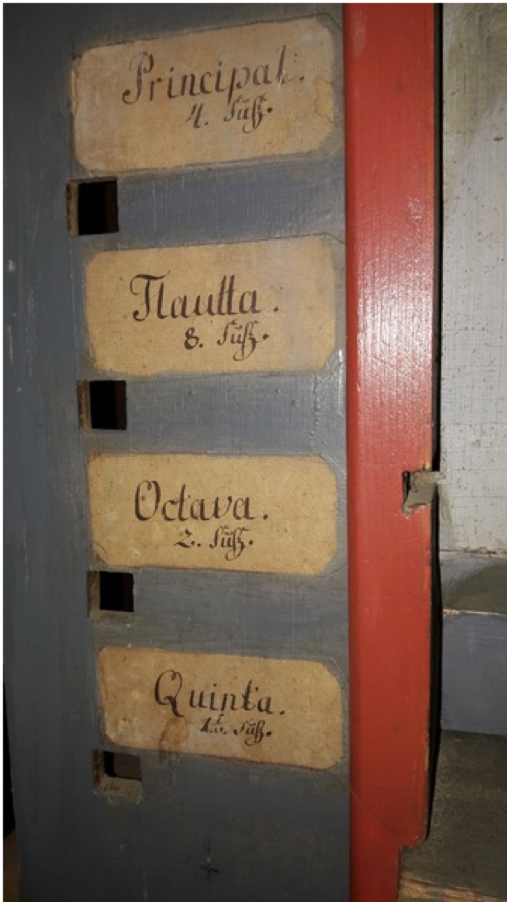
Registerschilder (original?) auf der "Rückseite" der Orgel. Sie war in Streitfort hinterspieligl Die