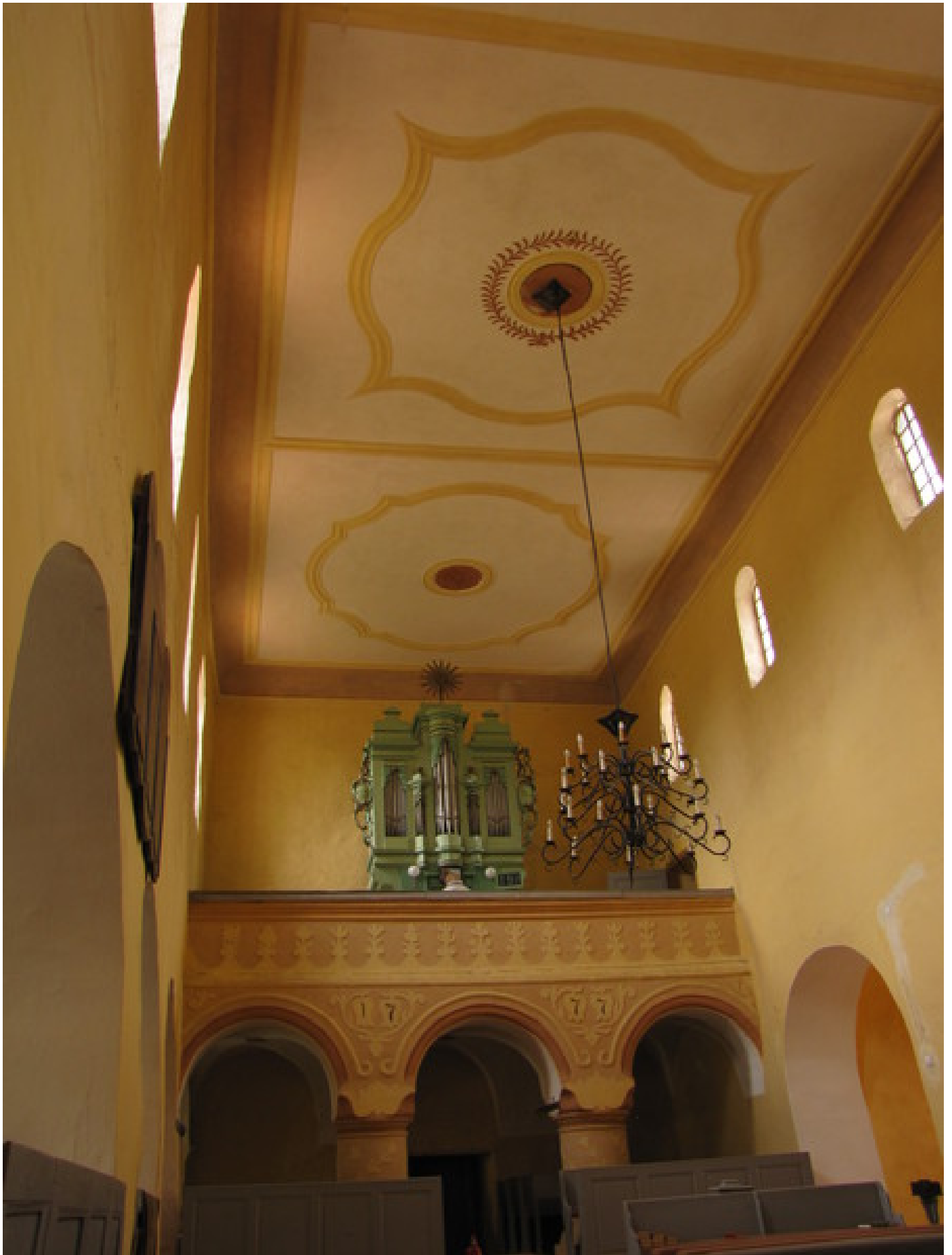
Orgel im Raum