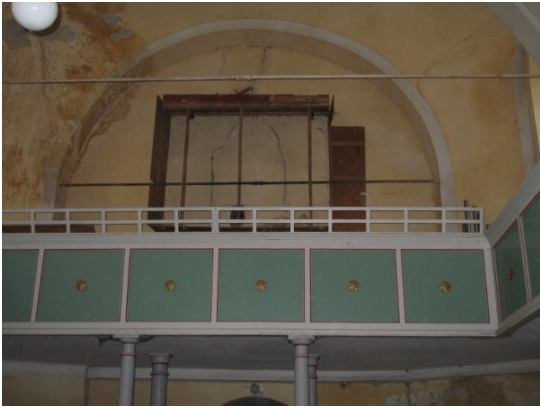
Westempore Hahnbach nach dem Abbau der Orgel