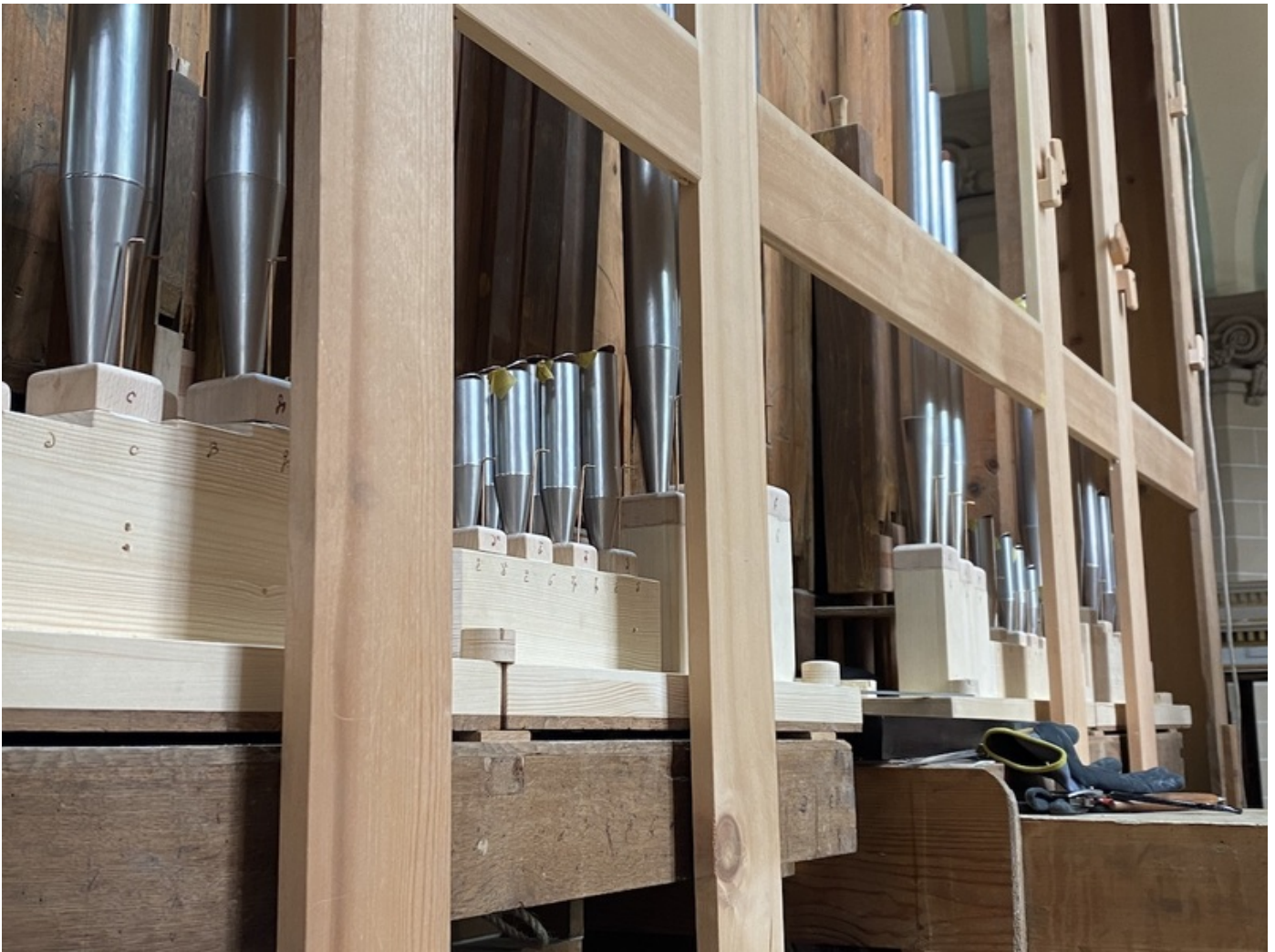
Die neugebauten, dem mutmasslichen Original nachempfundenen Pfeifen der Vox Humana haben am 5. Juni 2020 wieder ihren Platz in der Hahnbacher Orgel gefunden.