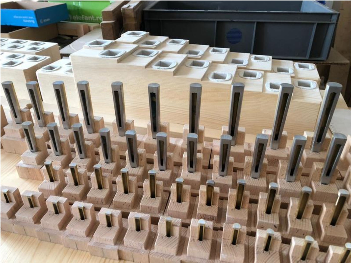
Vox Humana ohne Zungen / Stimmkrücken