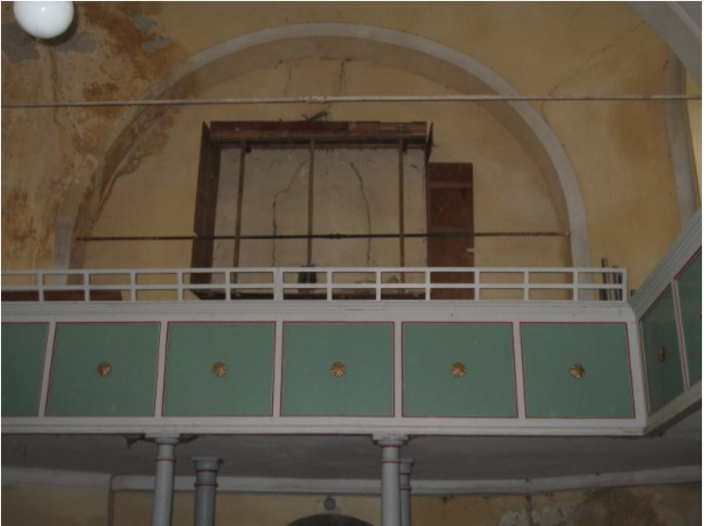
Westempore Hahnbach nach dem Abbau der Orgel