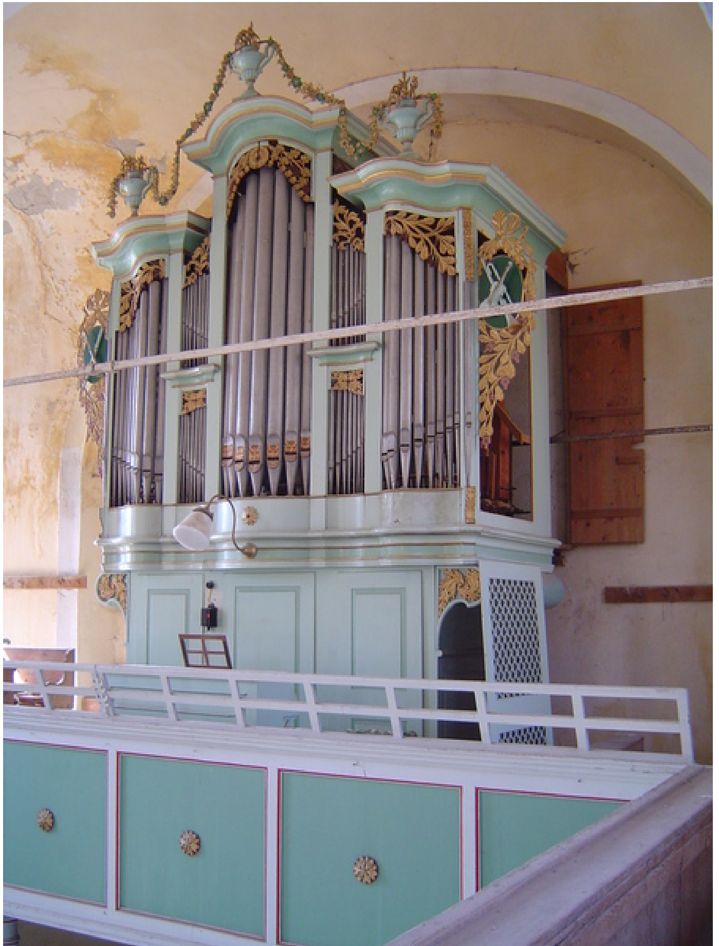
Orgel noch vollständig