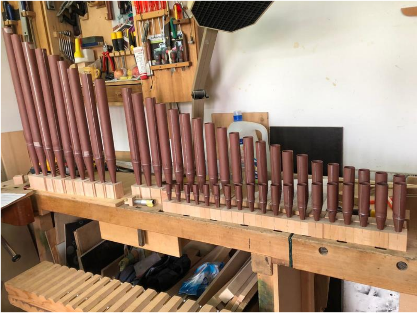
Vox Humana Rohbau