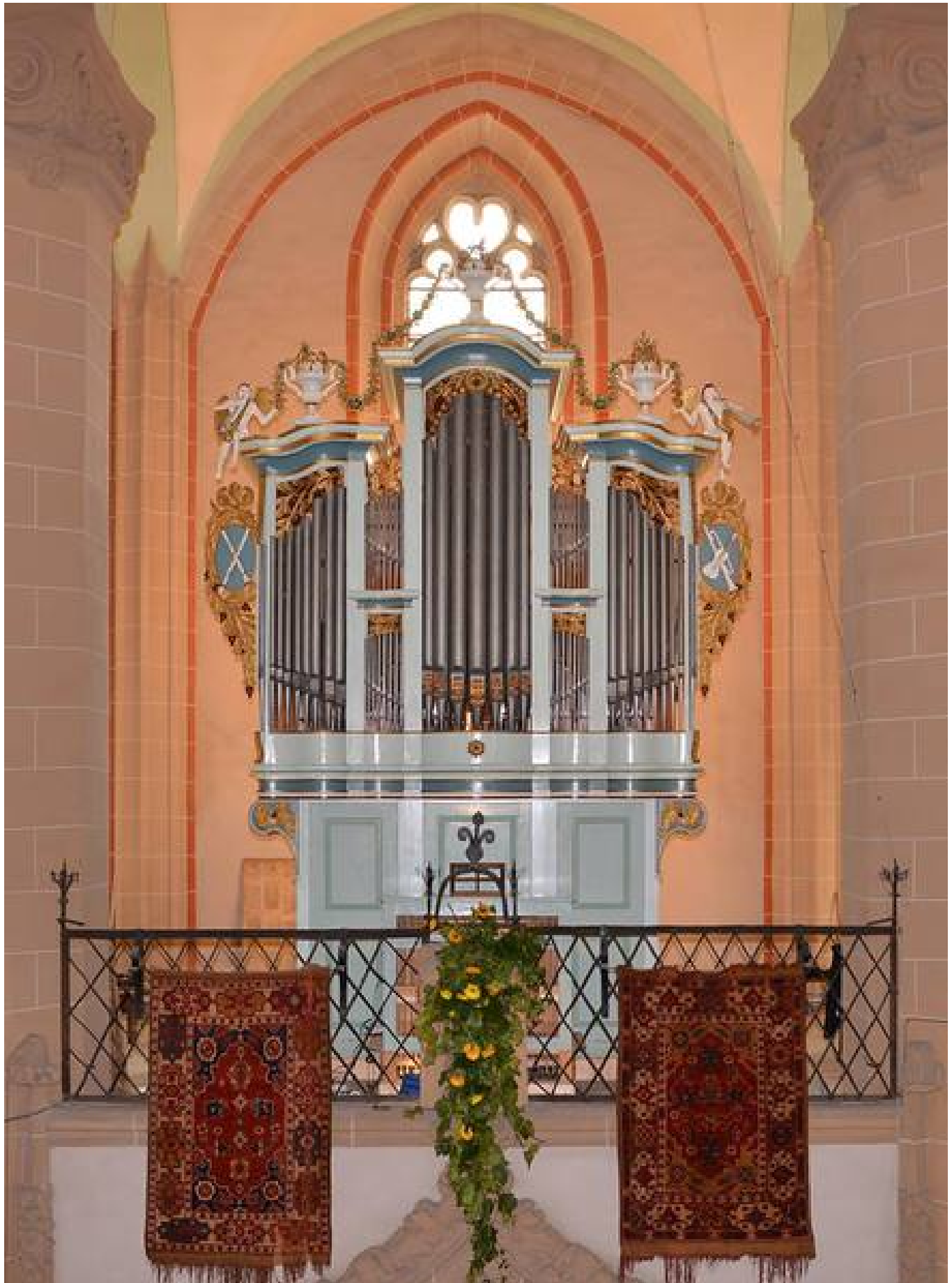
In Kronstadt 2013