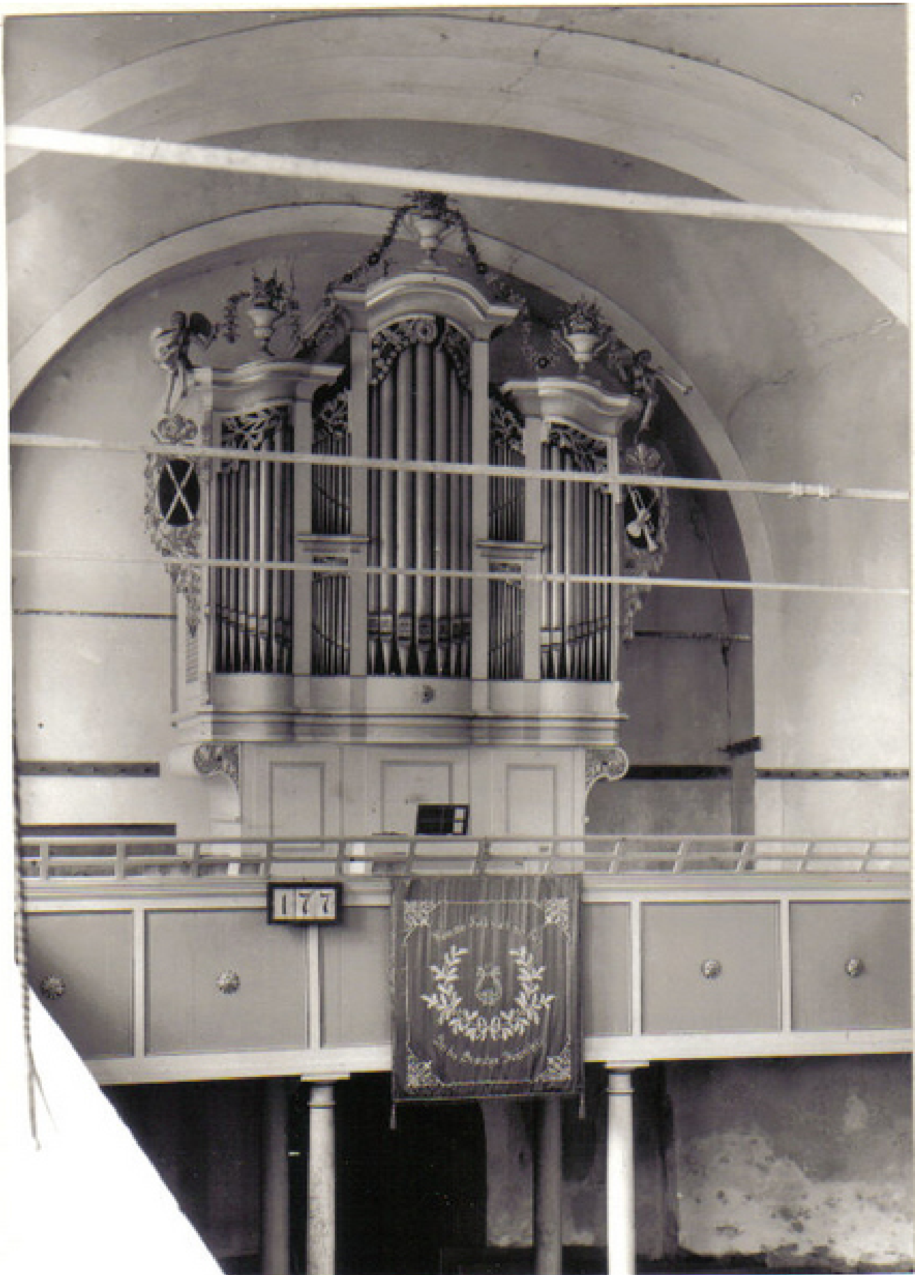
Prospekt, Foto von J. Fischer 1960