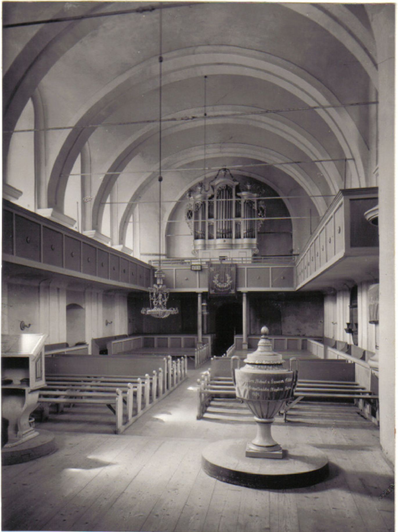
Orgel im Raum, Foto von J. Fischer, 1960