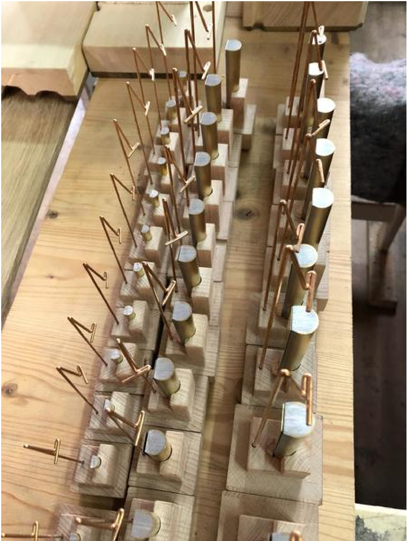
Vox Humana in der Werkstatt