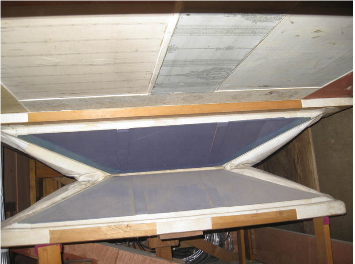
Balg mit div. Tapetenmustern