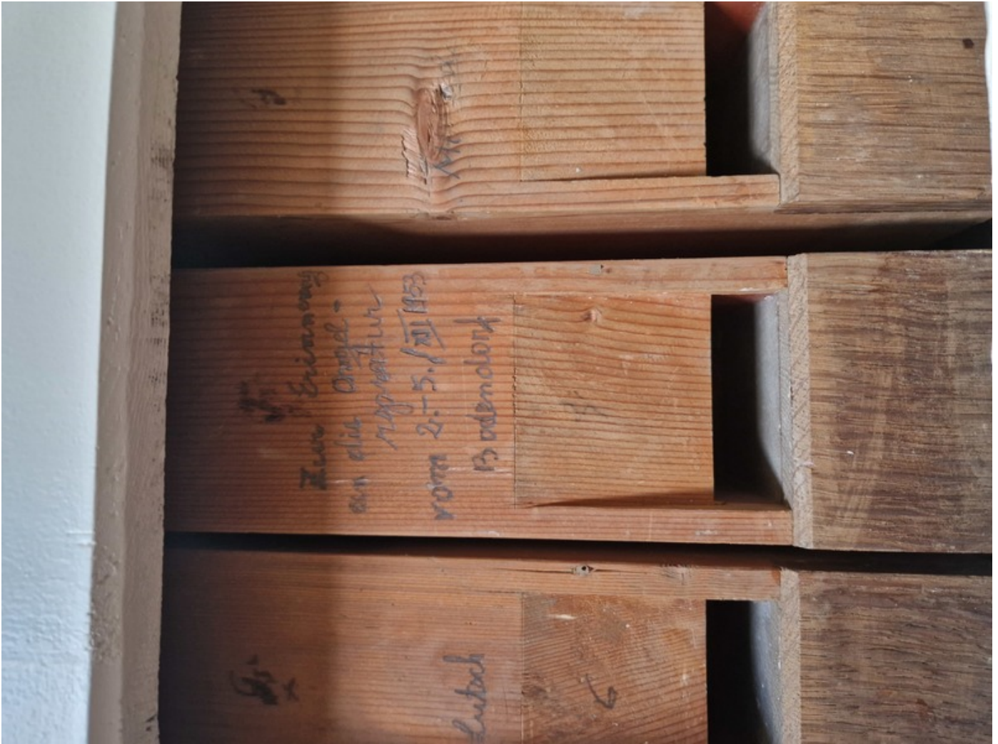
Inscription to an organ repair in the year 1953