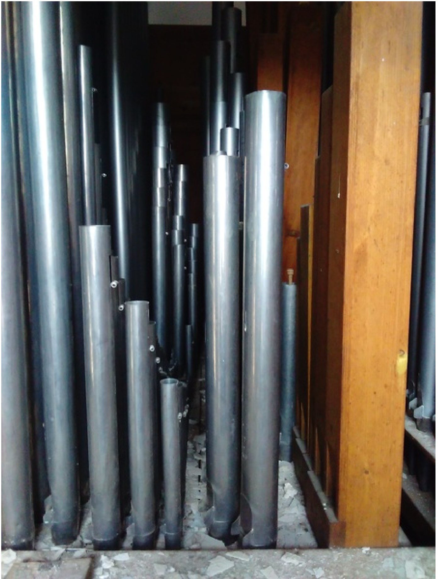
Pfeifenwerk mit Bauschutt nach der Innrenovation der Kirche, März 2016