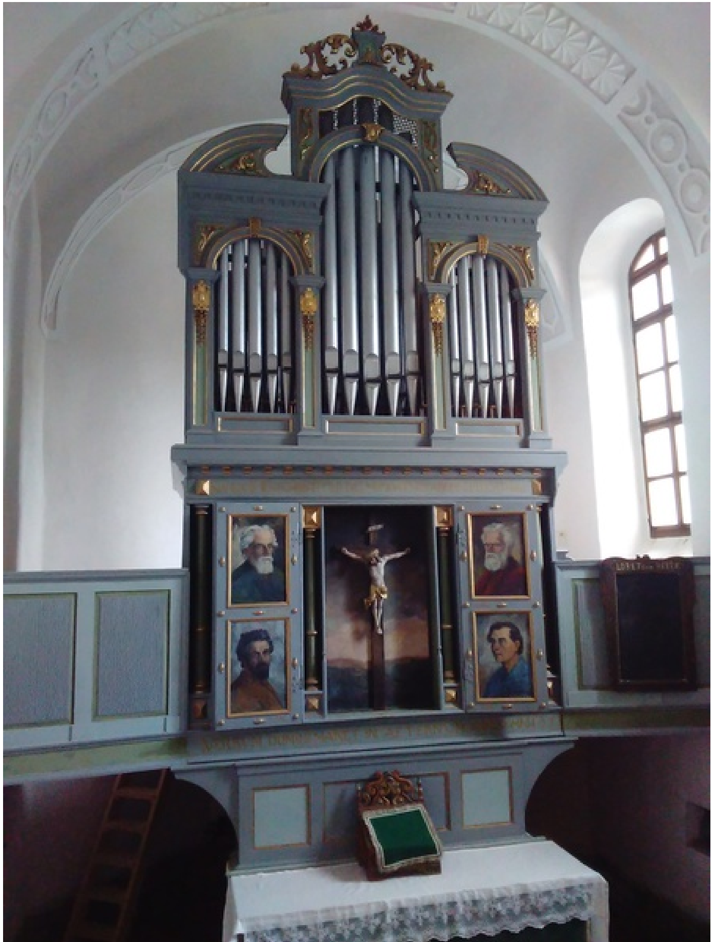
Gesamtansicht Altar und Orgel nach der Innenrenovation März 2016